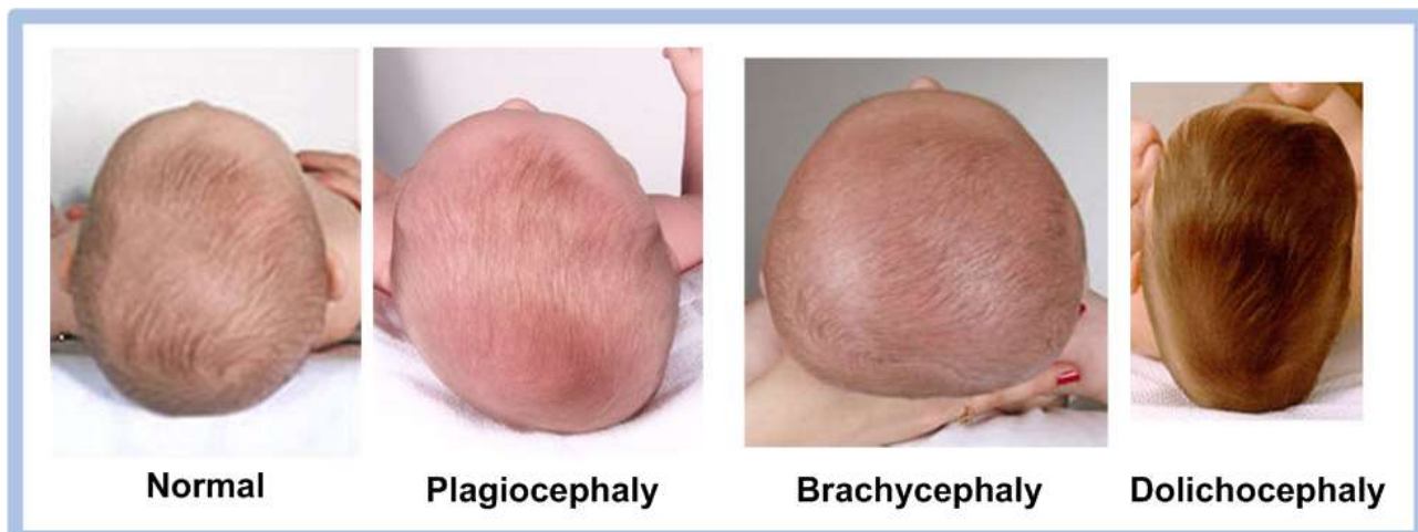
Børn med forskellige typer af fladt hoved syndrom

Mimos Pillow hjælper babyer ved at bevare deres hovedform på en naturlig måde uden nogen anden behandling. Men alle babyer tilbringer det meste af deres tid sovende på ryggen, så alle vil udvikle en vis grad af hoved deformitet. Tidlig forebyggelse spiller derfor en vigtig rolle i forebyggelsen af deformiteter af et barns hovedfacon. Derfor anbefales det, at bruge Mimos Pillow fra dag ét.